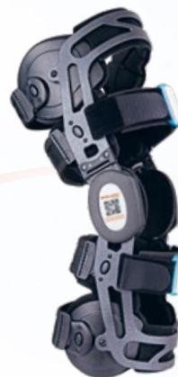
GENUDYN® OA SMART mit 2 Bewegungssensoren

Digitaler Trainingsassistent bei Gonarthrose