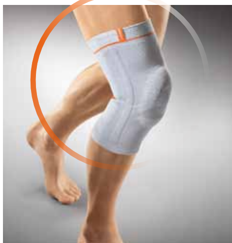
Abb. unten: Patentiertes Intarsia-Gestrick für faltenfreien Sitz und verbesserten Blut- und Lymphabfluss.

Abb. oben: Silikonring zur Druckentlastung der Patella.