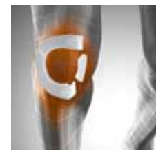
Abb.: Lateraler Halbring mit Zugbändern und mediale Pelotte.