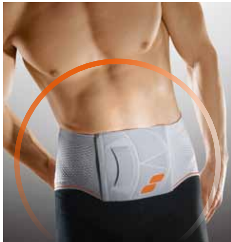
Abb. unten: Die anatomisch profilierte Silikonpelotte fördert eine entlordosierende physiolo- gische Muskelarbeit. Es resultieren verbesserte Körperhaltung und Koor- dination.

Abb. oben: 3D-Formgestrick für eine anatomisch perfekte Pass- form – gerade oder tailliert.