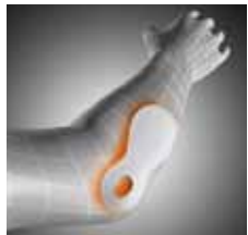
Abb.: Das kompressive und propriozeptiv wirksame Spezialgestrick mit medial und lateral eingearbeiteten Silikonpelotten entlastet das Ellbogengelenk, lindert Schmerzen und sorgt für eine beschleunigte Resorption von Ergüssen durch Hyperämisierung.

Ellbogenbandage mit genoppten Silikonpelotten zur Kompression und Friktion