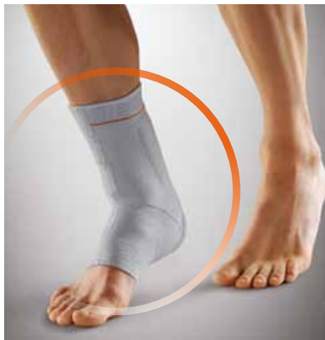
Abb. unten: Erleichterter Einstieg durch Klettverschlüsse.

_ KASSENÜBLICH _ Positions-Nr. 05.02.01.1006 _ Artikel-Nr. 07804