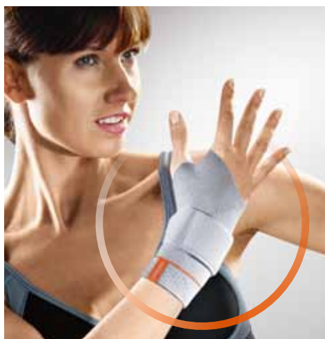
Abb. unten: Die volare Verstärkungschiene stabilisiert das Handgelenk in Funktionsstellung.

Abb. oben: Die integrierte Silikonpelotte besitzt eine Aussparung zur Vermeidung von Druckirritationen am Processus styloideus ulnae.