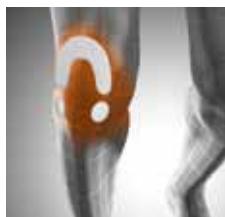
Abb.: Kombinierte Pelotten- wirkung zur Entlastung des Meniskus.

Kompressionsbandage mit variabel positionierbaren Druckpelotten und Friktionshalbring