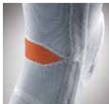
Abb. oben: Silikonring zur Druckentlastung der Patella.

Abb. unten: Patentiertes Intarsia-Gestrick für faltenfreien Sitz und verbesserten Blut- und Lymphabfluss.