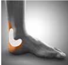
Abb. oben: 8-er Zügelung.

Abb. unten: Mediale und laterale Friktionspelotten.