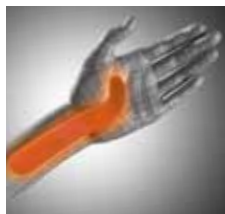
Abb. oben: Die integrierte Silikonpelotte besitzt eine Aussparung zur Vermeidung von Druckirritationen am Processus styloideus ulnae.

Abb. unten: Die volare Verstärkungschiene stabilisiert das Handgelenk in Funktionsstellung.