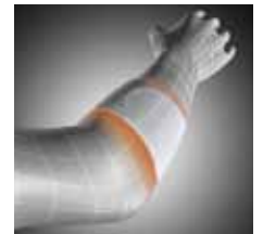
Abb.: Zirkuläres Band für gezielt dosierbaren Druck zur Zugentlastung des entzündlich veränderten Sehngewebes am Epicondylus.