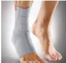
Abb. oben: Großflächige Pelotte mit Verlauf auf die Sehne des M. tibialis posterior.

Abb. unten: Erleichterter Einstieg durch Klettverschlüsse.